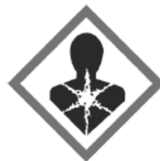
Mutagen Karzinogen Reproduktions-Toxisch Atemwegssensibilisierend Zielorgan-Toxisch Aspirationsgefahr GHS08