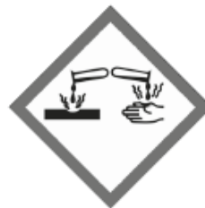
Metall korrosiv ätzend GHS05