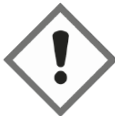
Gesundheitsschädlich Hautreizungen/sensibilisierend Augenreizungen Betäubende Wirkung Reizung der Atemwege GHS07