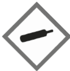
Unter Druck stehende Gase GHS04