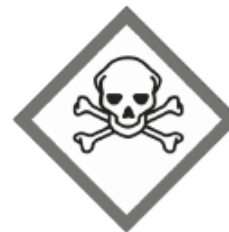
Giftig/Sehr giftig GHS06